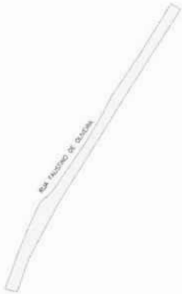
SECCIONAMIENTO DE LAS PARTES