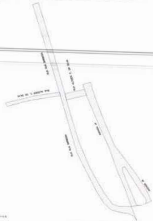
SECCIONAMIENTO DE LAS PARTES