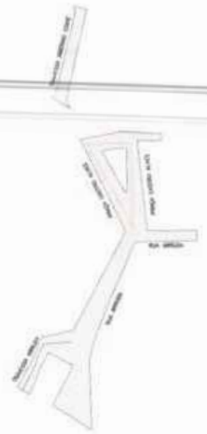
SECCIONAMIENTO DE LAS PARTES