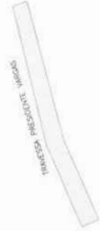
SECCIONAMIENTO DE LAS PARTES