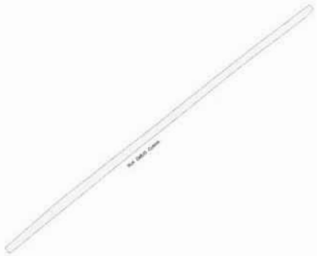
SECCIONAMIENTO DE LAS PARTES