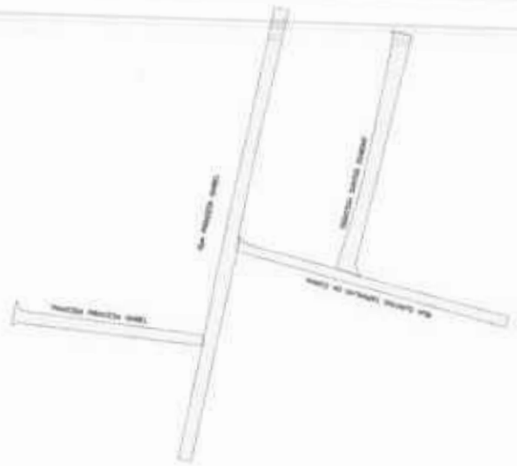
SECCIONAMIENTO DE LAS PARTES